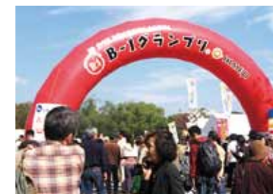
B-1グランプリ(※写真は昨年開催の姫路大会)