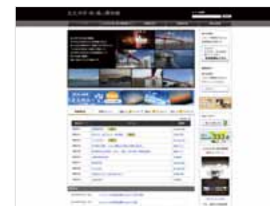
「北九州市 時と風の博物館」