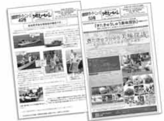
「地元いちばんニュース」で様々なイベントや出来事をお知らせしています。