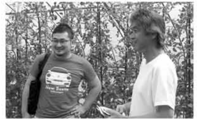
サポーター同士を繋ぎます! 販売店サポーターさんから、「イタリア料理に使う、西洋野菜が地元で手に入らないですか?」のご相談を受けて生産者を探したところ、小倉南区にいらっしゃいました!