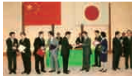
天津市との覚書調印

平成20年5月、首相官邸において北九州市と天津市の市長が覚書を調印し、両市のエコタウン協力が開始されました。自動車リサイクルをテーマとした検討を行ったほか、計画策定に対するアドバイス、行政官を対象とした訪日研修を行いました。2年目の平成21年度には、両市の企業間の交流を目的としたビジネスミッションの派遣を行い、また協力の成果を発表するセミナーを本市で開催しました。