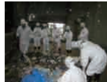
チョンブリ県6都市職員ごみ分析実習

地方分権が進むタイの地方自治体にとって喫緊の課題である廃棄物管理の分野で、本市の経験を活かした立案能力の開発および環境教育について行政官の人材育成事業の成果発表セミナーを実施しました。チョンブリ県内6都市では今後も自主的に広域協働事業を実施する予定です。