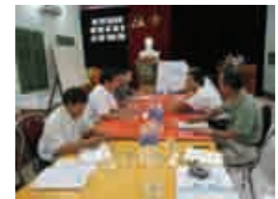
モデル工場と環境改善計画についての協議 (カルシウム・カーバイド工場)

ハイフォン市の環境改善を図るため、モデル工場の環境改善支援と環境啓発セミナーを行いました。モデル工場支援ではビール・焼酎工場を調査し、河川の汚濁負荷低減に向けた生産工程の見直しや排水処理方法などを提案しました。また、地域住民や地方行政官約 75 人が参加して環境啓発セミナーを開催し、環境が急速に悪化しているが、都市インフラ整備が遅れている現状や、住民啓発、廃棄物処理ビジネスなどの取組が紹介されました。