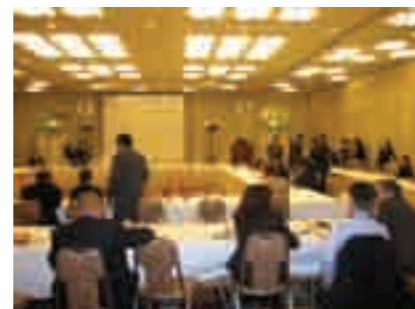
第 5 回北九州イニシアティブネットワーク会議

会議にはアジア諸国から 10 カ国 22 都市の市長や代表者、国内及び海外の中央省庁、国際機関、大学関係者等を含めて約 100 人が参加しました。会議の成果等は、北九州イニシアティブ最終報告書と共に、平成 22 年 9 月にカザフスタン(首都アスタナ)で開催される「第 6 回アジア太平洋環境と開発に関する閣僚会議」及び各種会議に報告します。