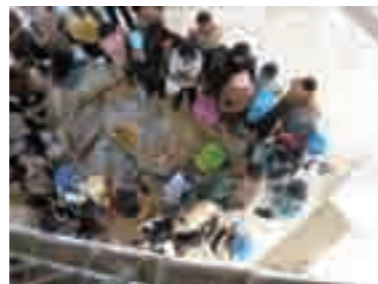
インドネシア・マカッサル市における市民セミナー

パレンバン他については、各都市の実施体制や今後のアクションプランの確認を行いました。