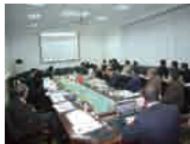
鞍山市での環境技術セミナー

その調査結果をもとに、平成 21 年度には水処理分野に重点を置いた技術交流ミッションに、地元企業を中心とした 9 社が参加し、大連・鞍山・瀋陽市の 3 都市で、水処理施設の視察や商談会を実施しました。