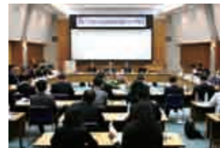
東アジア経済交流推進機構 第4回環境部会

また、共同プロジェクトとして、3カ国10都市が参加しての「海岸クリーンアップ事業」や中国の参加都市を対象に「環境人材育成事業」を下関市・福岡市と連携して実施しています。