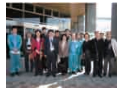
環境部会人材育成研修