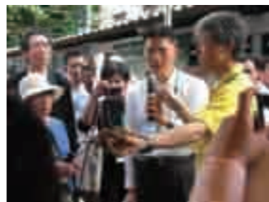
バンコク都でのコンポスト実践セミナー

増加する廃棄物の処理が深刻な問題となっているバンコク都に対して、廃棄物の適正処理及び資源化のための調査を行い、生ごみの堆肥化、資源化物の分別収集促進などについて助言・協力を行いました。