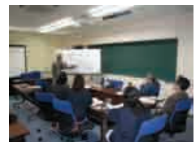
北九州市における研修風景

ハイフォン市行政官の監視指導能力の向上を図り、省エネ・省資源及び環境保全を推進するため、専門家派遣及び受入研修を行いました。専門家派遣では、省エネ等推進に係る法令やその運用状況、施策などの現状調査を行いました。また、2 名の研修員を受入れ、本市の行政施策や企業の省エネ対策を参考事例として、環境保全の推進により省エネ・省資源が推進されることや、監視指導の重要性など、省エネ・省資源推進に必要な知識やノウハウを学ぶ研修を行いました。