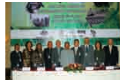
環境的に持続可能な都市ハイレベルセミナーの主要参加者

この会議の成果は、平成 22 年秋開催の第 2 回 EAS 環境大臣会合に報告されます。