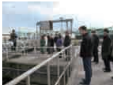
日明浄化センターでの研修

中国三大汚染湖のひとつである滇池の水質改善を図るため、円借款を使って下水道の整備を行っている昆明市から、下水道分野の研修員6名を受け入れ、本市の下水道事業運営手法や下水汚泥の有効活用の方策などの講義・現場視察などを行いました。