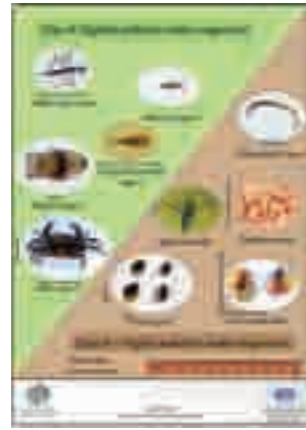
環境教育用教材（図鑑）

スリランカに専門家を派遣し、河川の汚染度と生息する水生生物の関係を調査しました。調査結果を相手国と共同でまとめ、環境教育用教材として、ガイドブックと図鑑を作成しました。これらの教材をスリランカの環境教育の実践に活用し、河川の水質改善についての住民意識の向上に役立てていきます。