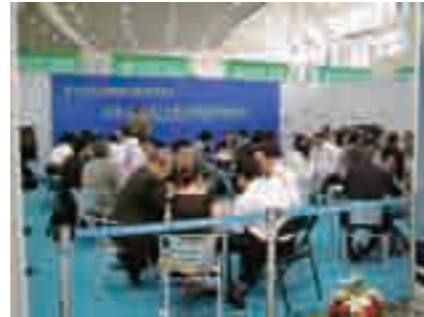
北九州 - 大連環境ビジネス商談会

平成 20 年度は、例年の博覧会参加に加えて、北九州環境ビジネス推進会 (KICS)、大連市環境保護産業協会及び北九州市、大連市の 4 者共催による「北九州一大連環境ビジネス商談会」を実施しました。平成 21 年度は、本市で開催された「エコテクノ 2009」に大連市企業を 11 社招聘しての出展や地元企業との商談会を実施しました。