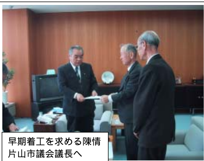
早期着工を求める陳情 片山市議会議長へ