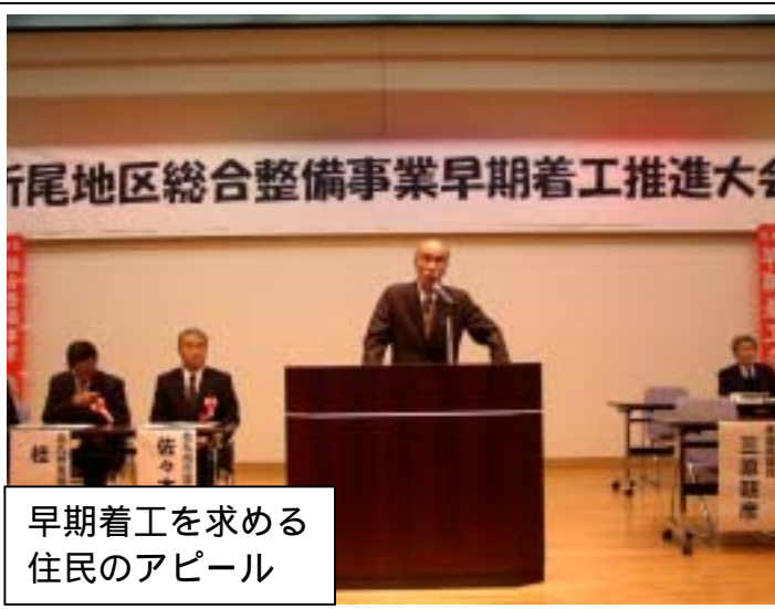
早期着工を求める住民のアピール

事業をとりまく地元の状況や将来を考えた折尾地区のまちづくりについて、国土交通省・福岡県・JR九州などの関係機関と調整を行いながら総合的に判断した結果、昨年8月の公聴会以降中断していた「都市計画決定の手続き」を再開することにしたものです。