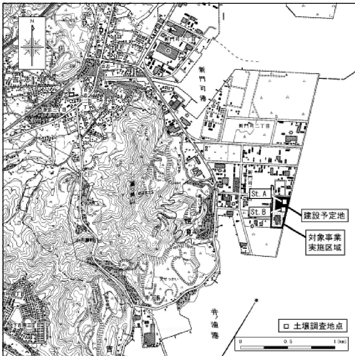
図5 - 5 4 土壌の調査地点（環境基準27項目）