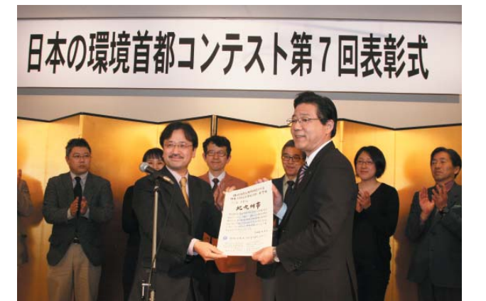
第7回「日本の環境首都コンテスト」表彰式(平成20年3月)

今後も、世界の人々から「世界の環境首都」として認められるよう、より一層の取組を進めていきます。