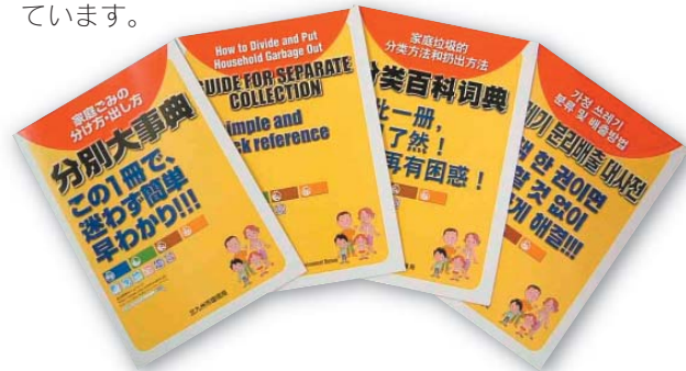
(英語・中国語・ハングル表記のものも作成しています。)

「資源」と「ごみ」の分け方・出し方を知ってもらうため、一目でごみの分類や出し方が分かる目次兼分別一覧表や、出し方に迷うものが簡単に調べられる50音順の分別早見表等を掲載した冊子を、区役所や市民センター等で配布しています。