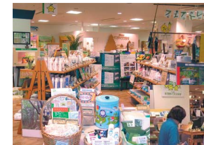
エコ商品の展示・販売の様子

資源循環型ライフスタイルの啓発、グリーンコンシューマーの育成拠点として、平成14年11月にエコライフプラザをアジア太平洋インポートマート2階に開設しました。NPO法人に企画・運営を委託し、エコ商品の展示、販売、リユース品の販売、エコライフに関する情報の提供、毎日の生活に役立つ環境講座などを実施しています。(運営についての詳細は57ページ)