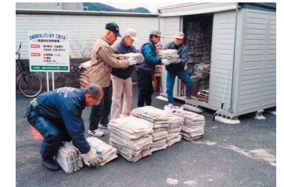
保管庫を利用した古紙回収